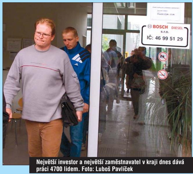
Největší investor a největší zaměstnavatel v kraji dnes dává práci 4700 lidem.

Největším investorem na Vysočině je jihlavský strojírenský podnik Bosch Diesel. Ten v kraji zatím vydal přes 13 miliard korun a nyní zaměstnává 4700 lidí. Významný příliv financí je spojen i s budováním firem výrobců autodílů Zexel Valeo v Humpolci na Pelhřimovsku, havlíčkobrodské Futaby, výrobce dřevotřískových desek Kronospan v Jihlavě nebo pily Stora Enso Timber ve Žďírku nad Doubravou.