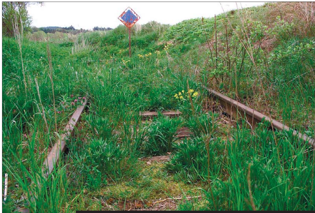
Koleje trati dnes končí za Slavonicemi. Plevellem a rzí.

Stavba bude stát asi 300 milionů korun, z toho asi desetinu český úsek. Ministerstvo dopravy a Státní fond dopravní infrastruktury prý s takovou investicí budou